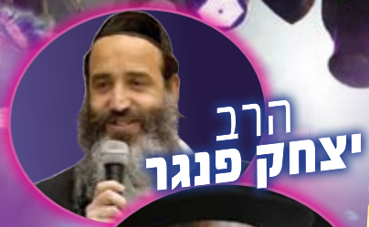
הרב יצחק פנוגר